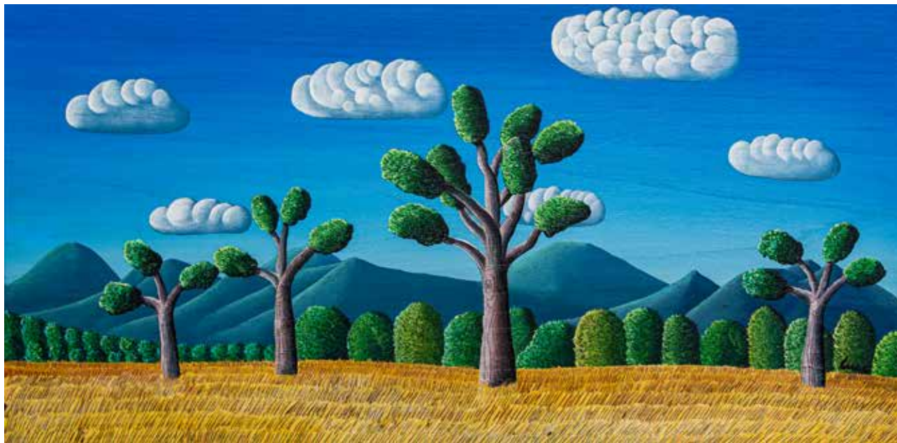
Sinfonia di agosto 2022 , cm 48X68, acrilici su tavola di castagno secolare