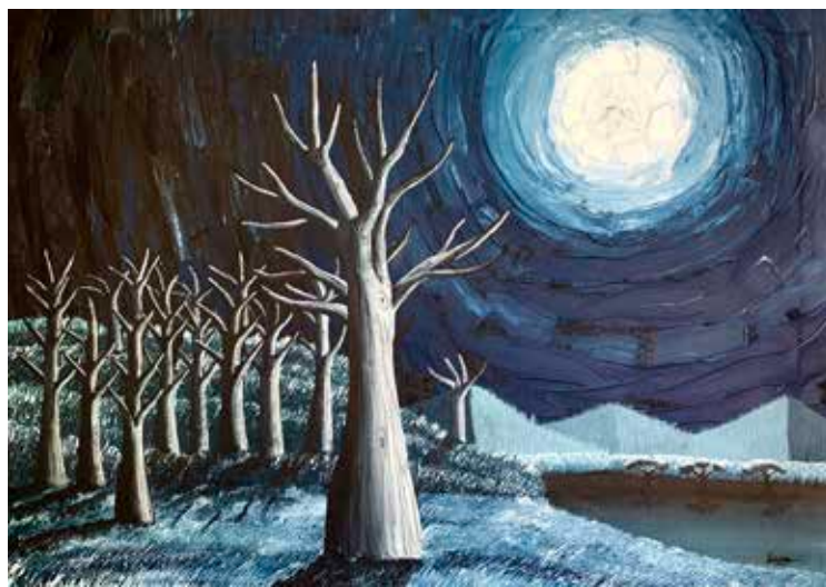
Il mondo continua a gelare, ma il blu terso pur non riscaldandoci, riflette il nostro animo, denodandone l'esistenza (la guerra) 2022, cm100X70, acrilici su jeans