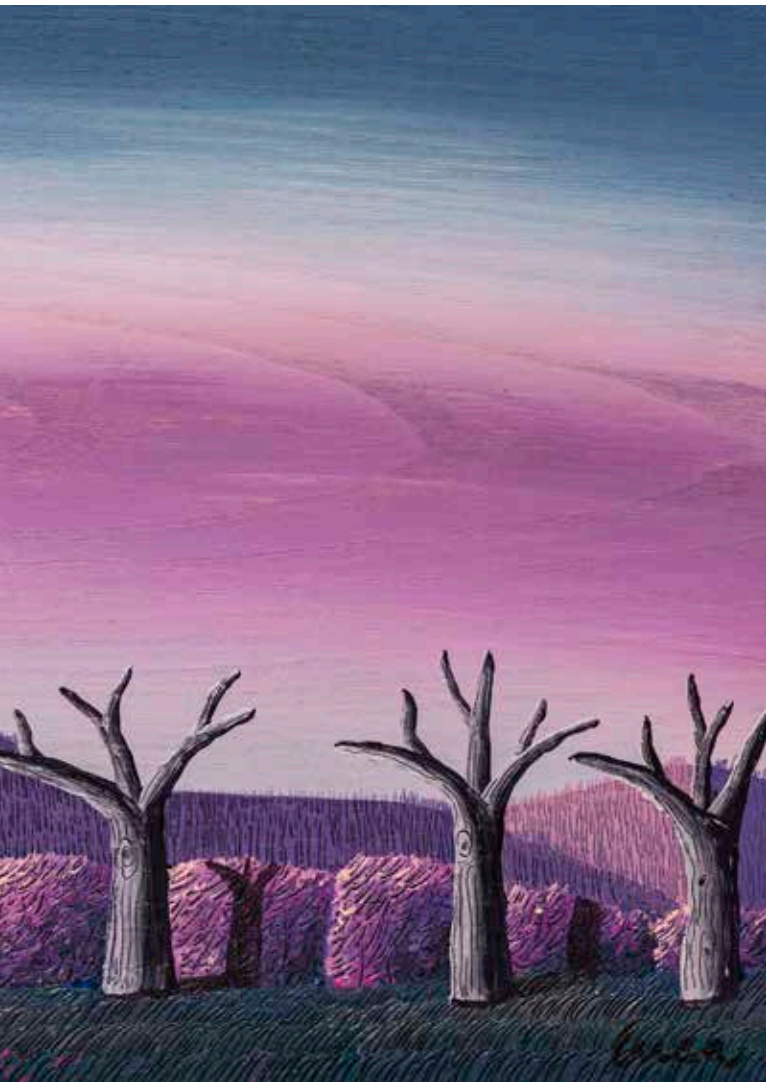
Sinfonia di fronte al tramonto di febbraio 2021, cm 32,6X63,2 - acrilici su tavola di castagno secolare