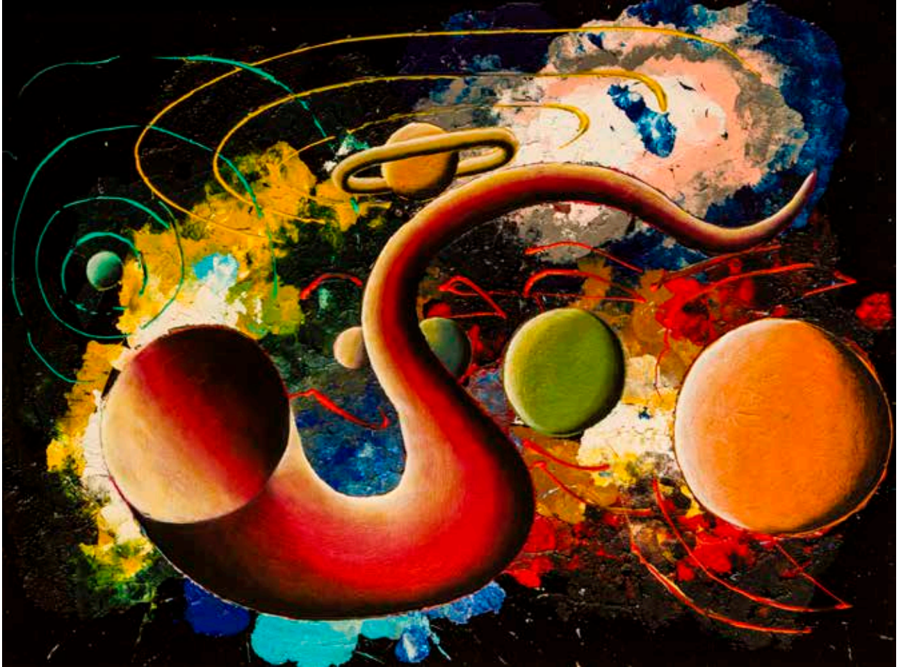
Buco Nero 2016, cm 60X80, acrilici su jeans