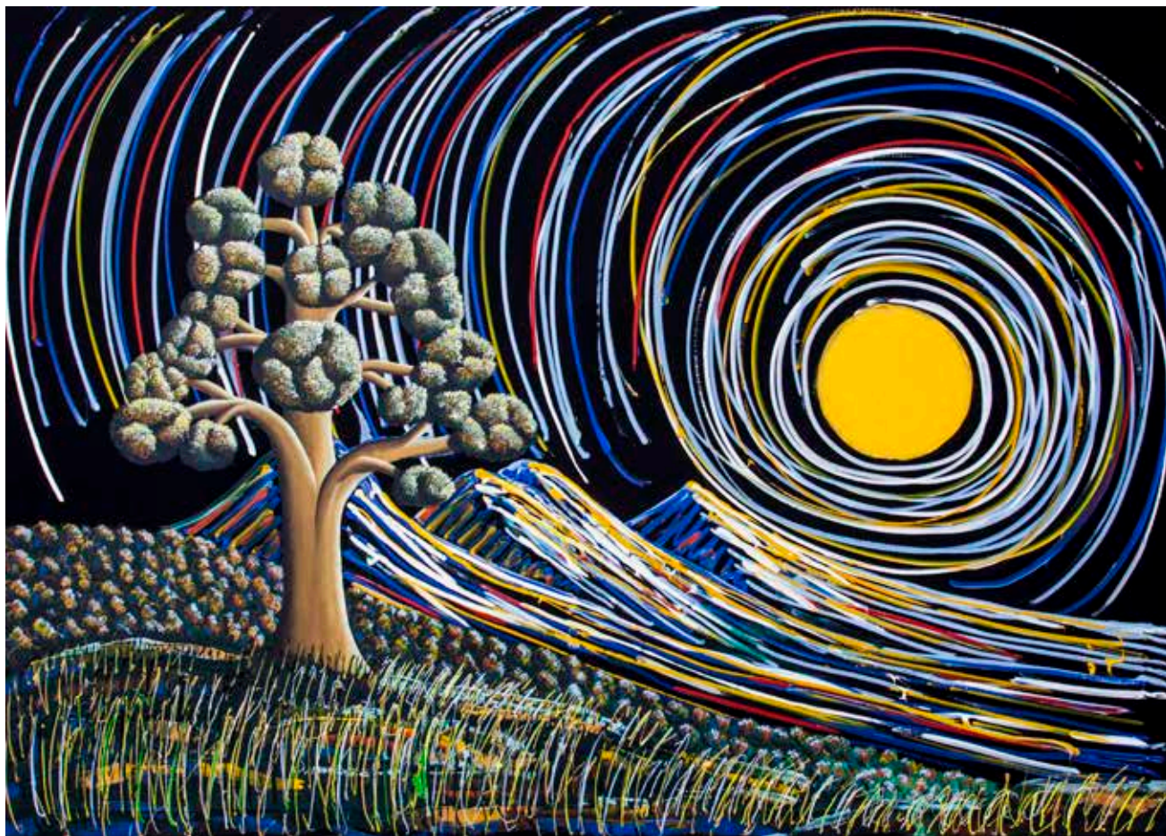
Armonia 2014, cm 150x210, acrilici su jeans