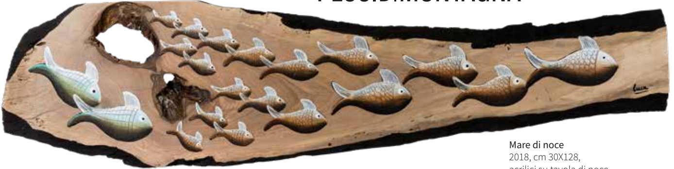
Mare di noce 2018, cm 30X128, acrilici su tavola di noce