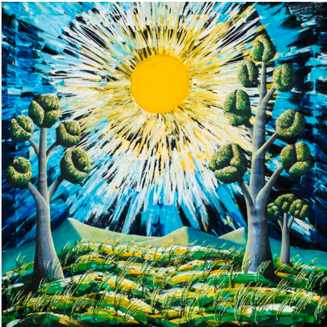
Lume 2105, cm 150x150, acrilici su jeans