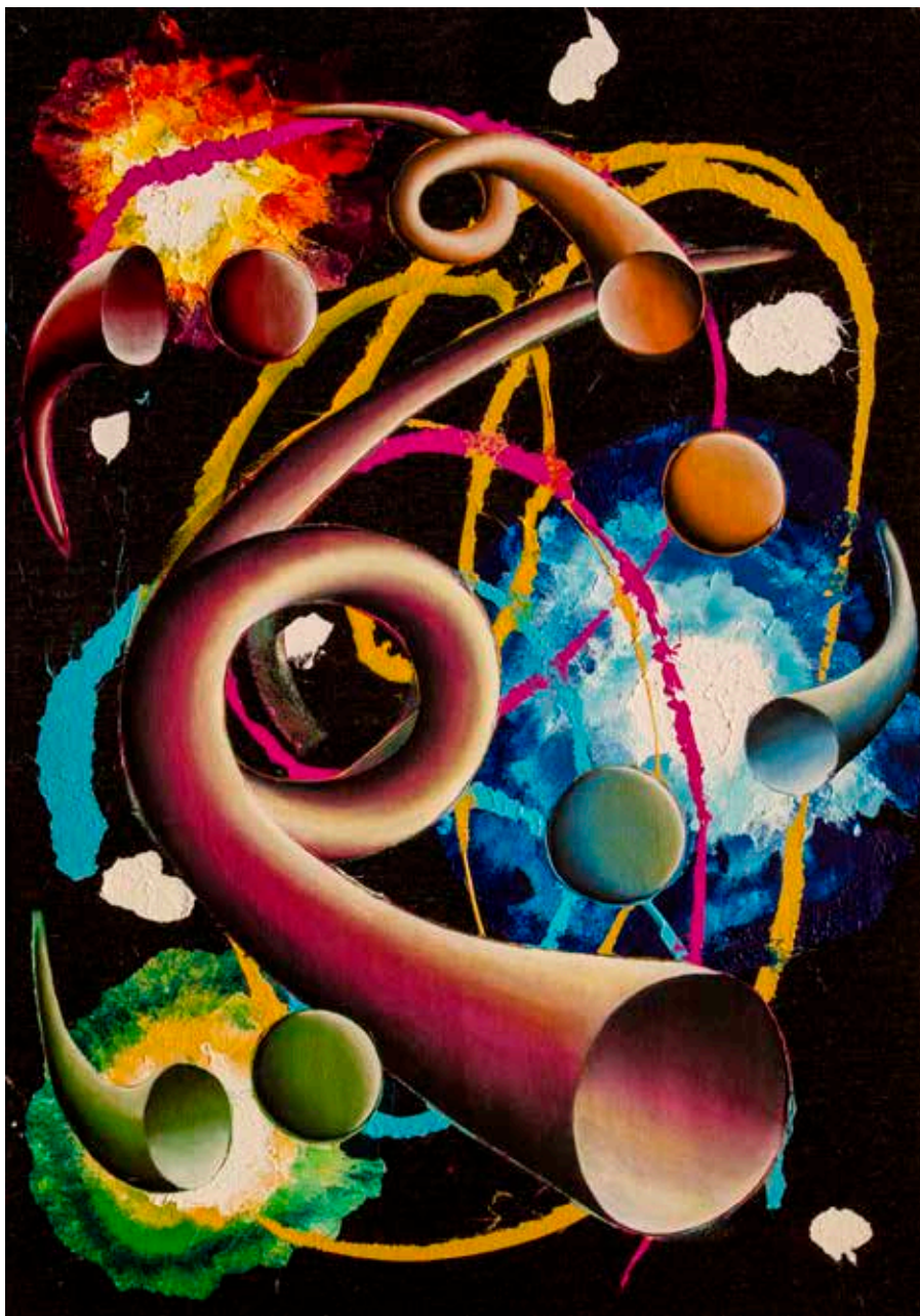
Sinfonia del Big Bang 2016, cm 100X70, acrilici su jeans