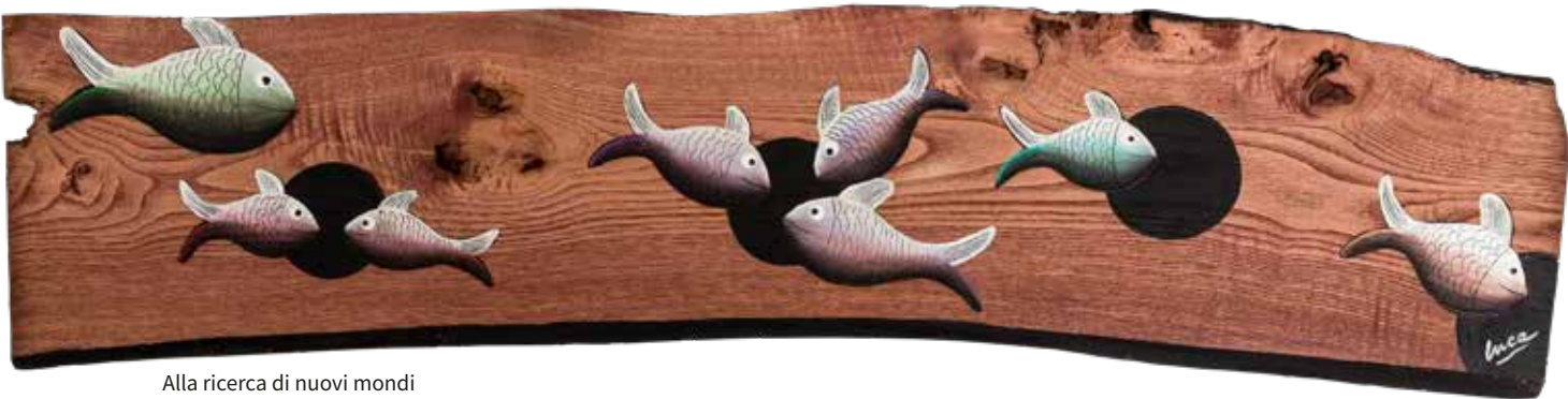
Alla ricerca di nuovi mondi 2019, cm 22X100, acrilici su tavola di castagno